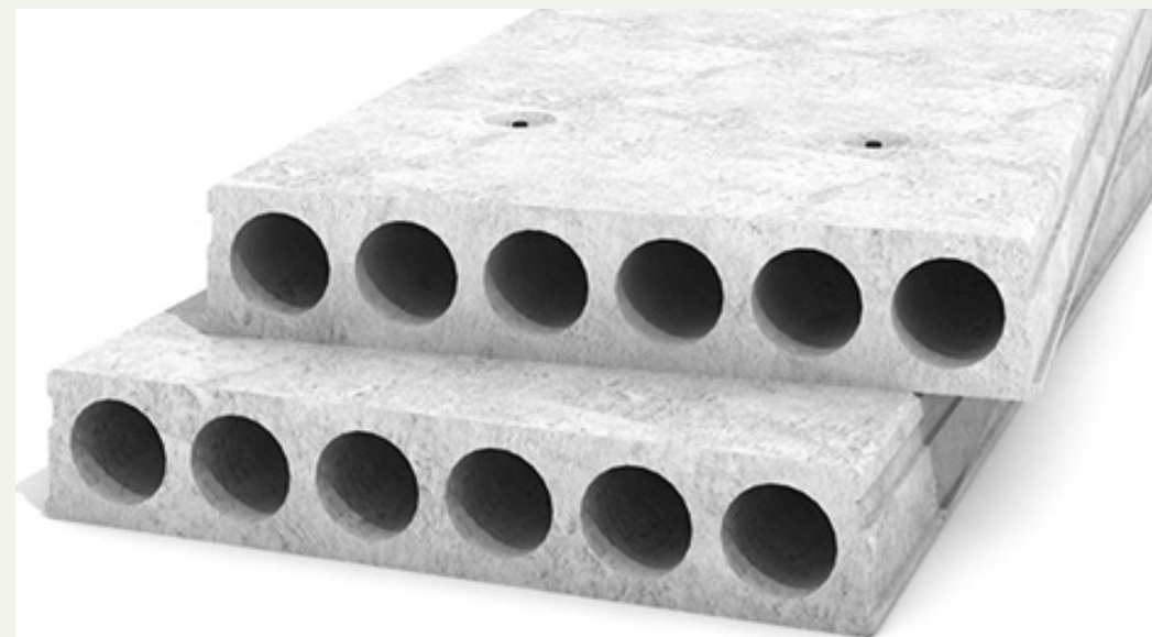
Betonloft / huldæk

Find alt du behøver at vide i beboermappen Der kan gælde særlige regler for netop din ejendom